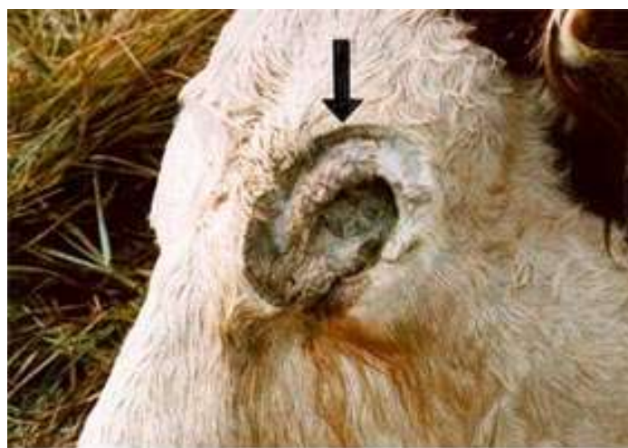
Sharp looking cut around the eye.

Cas n°2: Le 16 octobre 1998 à 16h. près de Uinta Basin (Utah). Une vache, la plus chère du troupeau, en bonne santé la veille, fut découverte par son propriétaire étendue dans une zone de terre humide. L'animal était étendu, couché sur son avant, les pattes avant pliées sous elle et les pattes arrières allongées vers l'arrière. Pas de traces de combat ni d'empreintes autour de l'animal. L'oreille de l'animal avait été découpée ainsi que son œil. L'œil a été découpé inclus dans une partie de chair large d'environ un centimètre autour de lui.